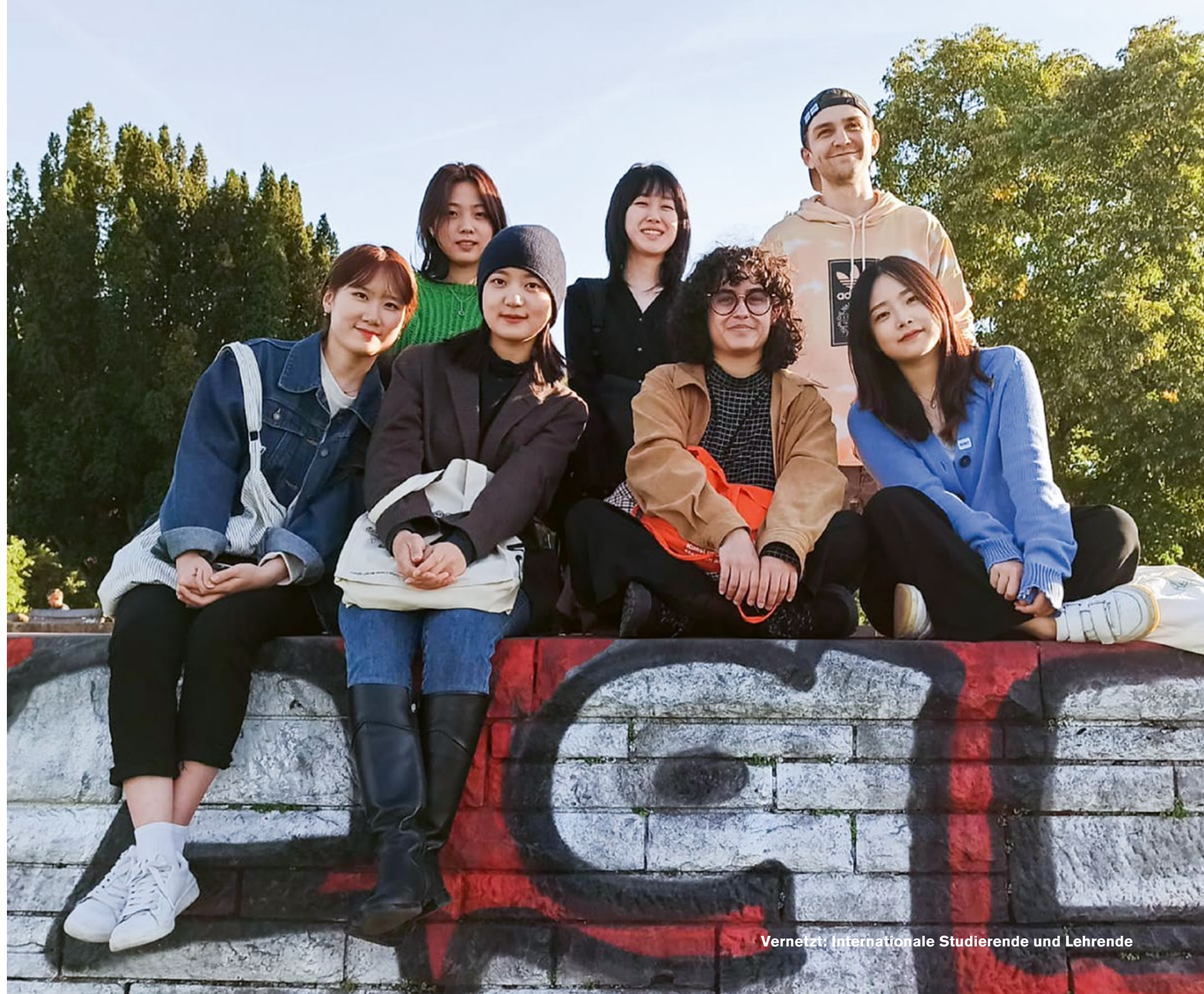
Vernetzt: Internationale Studierende und Lehrende

Academy of Fine Arts Gdansk, Danzig, Polen Athens School of Fine Arts, Griechenland École de Recherche Graphique (ERG), Brüssel, Belgien École Nationale Supérieure D'Arts de Paris-Cergy, Frankreich Fachhochschule Nordwestschweiz FHNW, Windisch, Schweiz Gerrit Rietveld Academy, Amsterdam, Niederlande HEAD – Geneva School of Art and Design, Genf, Schweiz Hongik University, Seoul, Südkorea The Royal Danish Art Academy of Fine Arts, Kopenhagen, Dänemark Shanghai Theater Academy, China Srishti, Institute of Art, Design and Technology, Bangalore, Indien Taipei National University of the Arts, Taipei, Taiwan Universidad Autónoma de Madrid, Spanien Universidad del Rosario, Bogotá, Kolumbien Universität für angewandte Kunst, Wien, Österreich University Beira Interior, Covilhã, Portugal University of Luxembourg, Esch-sur-Alzette, Luxemburg University of Portsmouth, UK University of Warmia and Mazury, Olstyn, Polen Vilnius Academy of Arts, Vilnius, Litauen Willem de Kooning Academy, Rotterdam, Niederlande